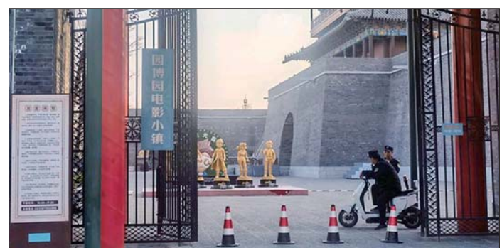
济南华谊兄弟电影城已更名为园博园电影小镇。