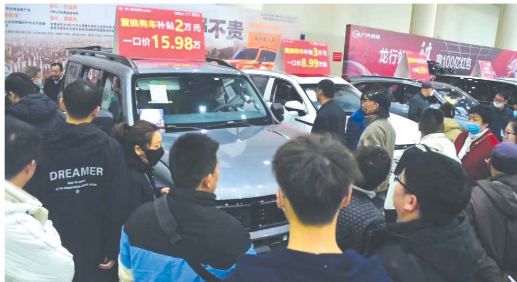
在2024济南新春车展现场,众车企争相推出优惠措施。

2024年春节刚过,国内车企就迎来了一番龙争虎斗。这场由比亚迪领衔的“开年大戏”,精准锁定了车企商战的“大动脉”——价格。无论是主动迎战,还是被动“放血”,几乎所有车企都参与这场价格战中。近日,记者走访了多家车企线下门店,发现这场价格战已经深入销售一线,并产生了明显影响。适当的车企价格战,也让消费者得到了实惠。