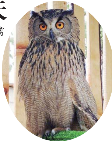
这只雕鸮已经在救助中心生活了七年。

在济南市莱芜区,藏着一家其貌不扬的“猛禽医院”。几乎每周,都会有猛禽在这里振翅而起,重返蓝天。“我所期待的美好未来,当有草长莺飞,也当有猛禽翱翔。”投入猛禽救护工作12年,这是济南翱翔猛禽救助中心(简称“救助中心”)负责人胡海磊的志愿。