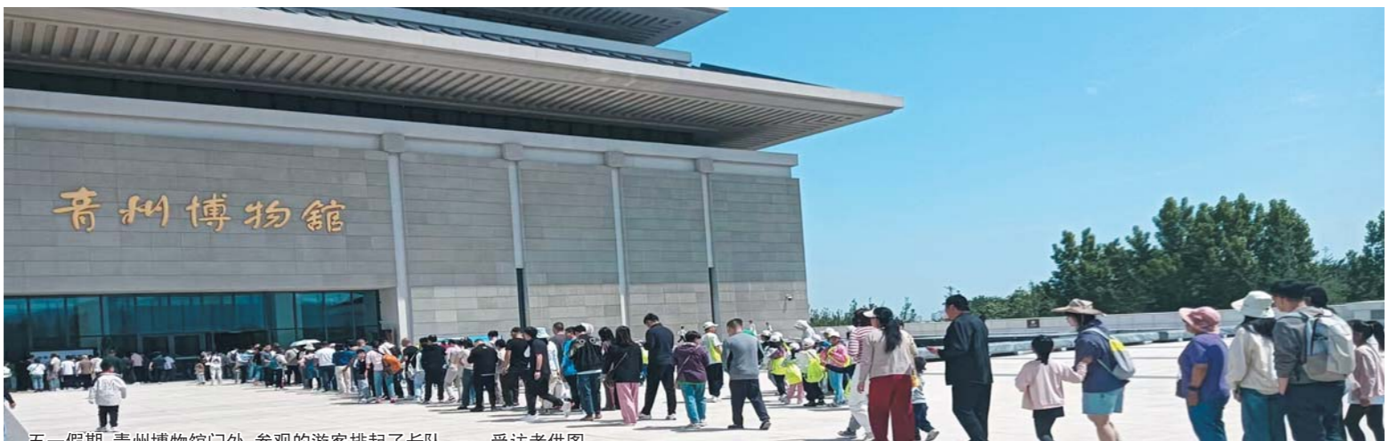
五一假期,青州博物馆门外,参观的游客排起了长队。

读者想预约参观可以关注“青州博物馆”微信公众号,点击右下角“参观服务”,选择第一项“参观预约”即可。