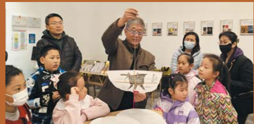
青州博物馆不仅有展览,还有丰富的社教活动。