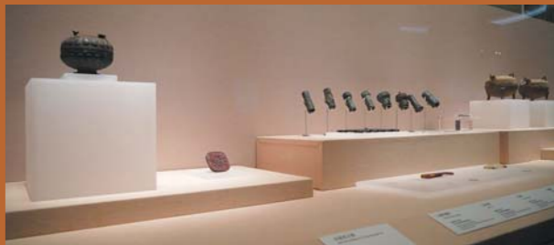
▶青州博物馆内的很多文物都体现了光影美学。