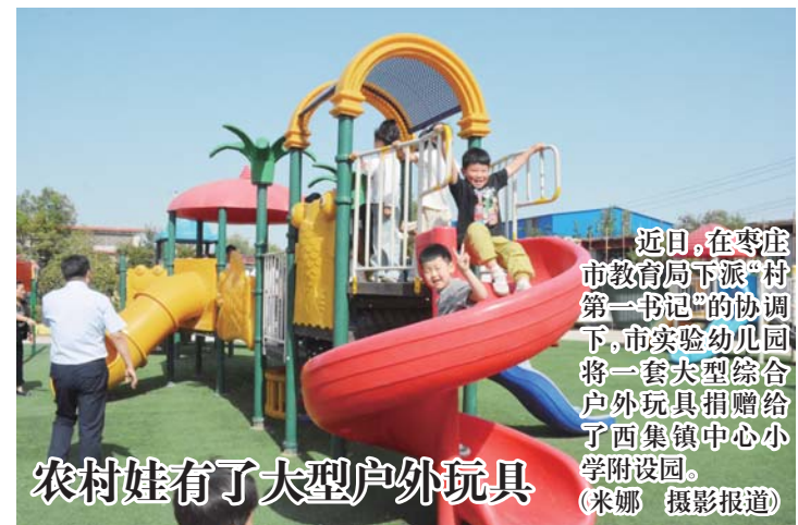
农村娃有了大型户外玩具

邓淇强调，要在持续提高普惠性资源供给能力、持续争取普及普惠县创建、持续攻坚优质园占比、持续推进办园模式改革、持续规范幼儿园管理、持续推动学前教育内涵发展六个方面下功夫；要借着全国学前教育宣传月的东风，坚定目标，明确重点，紧盯任务，落实责任，将“守护育幼底线 成就美好童年”落实到位，加快推进学前教育改革发展，向着普及、普惠、安全、优质的目标，砥砺奋进，持续奋斗，用更好的状态，更优的成绩，努力办好人民满意的学前教育。