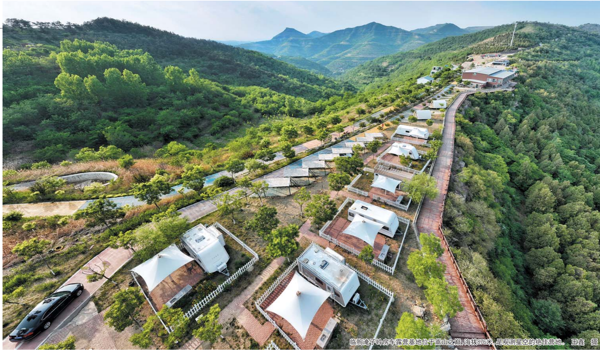
临朐燕子岭房车露营地坐落于嵩山之麓,海拔376米,是观湖星空的绝佳营地。