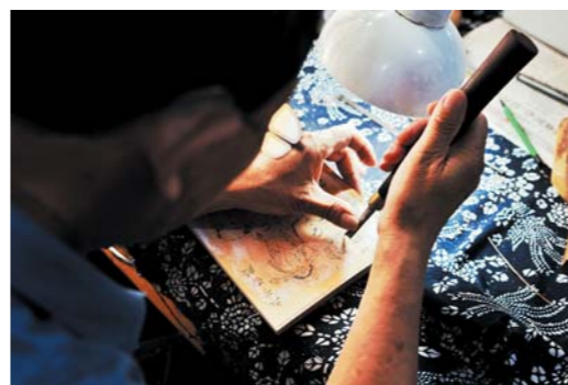
已有600余年历史的杨家埠木版年画,以“粗犷朴实、造型夸张、图文并茂”等艺术特色著称于世。

如此深耕,不愧是“冠军之城”。潍坊是一座新闻的富矿,将以独特的视角,助力更好潍坊出圈出彩。