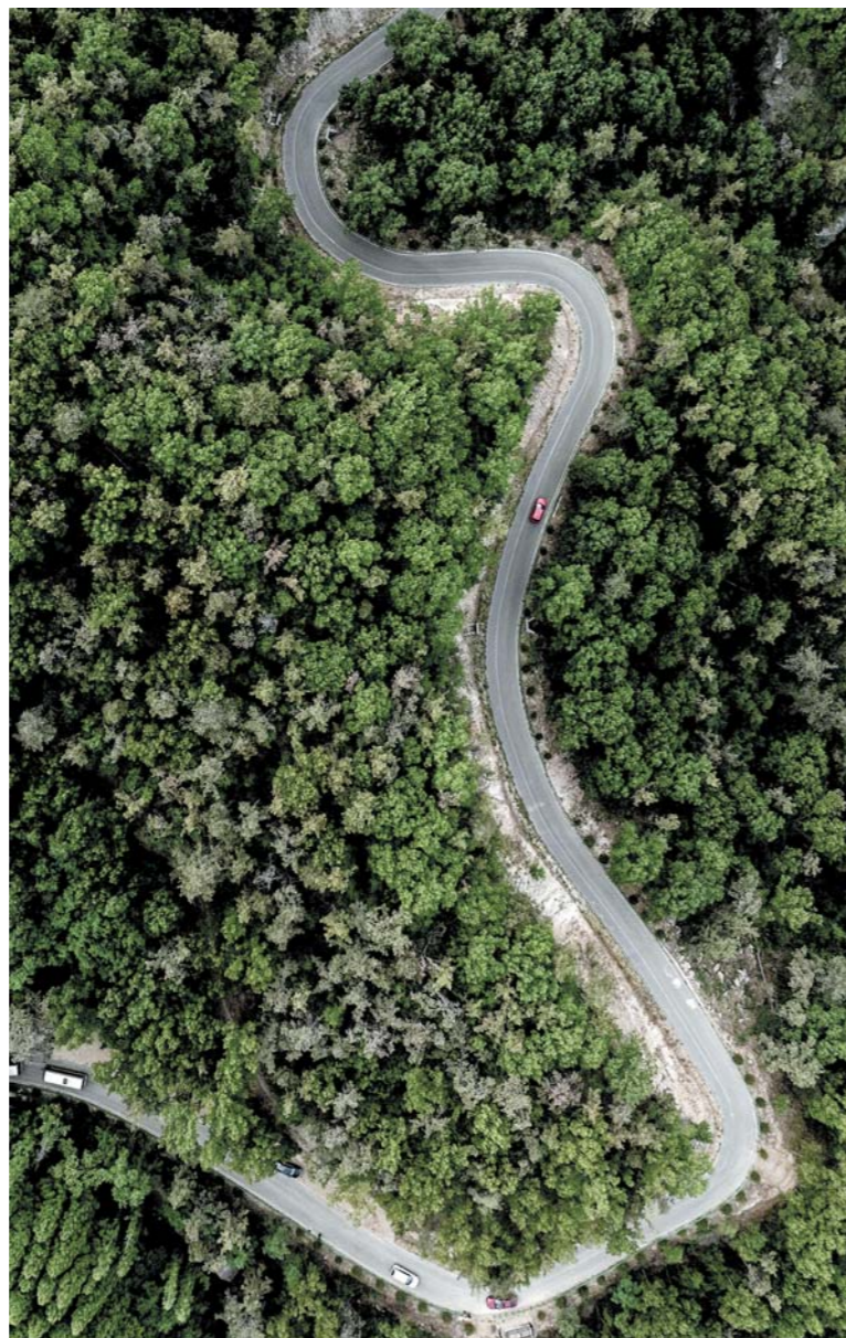
主干道300余公里的齐鲁天路,是一条可媲美川藏318的自驾山路。