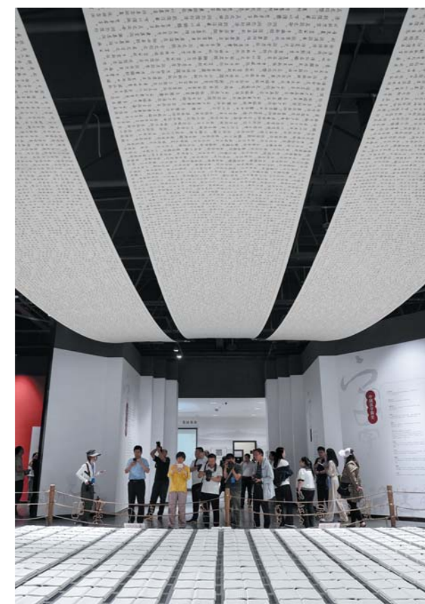
◀置身仓颉汉字艺术馆,领略汉字艺术之美。