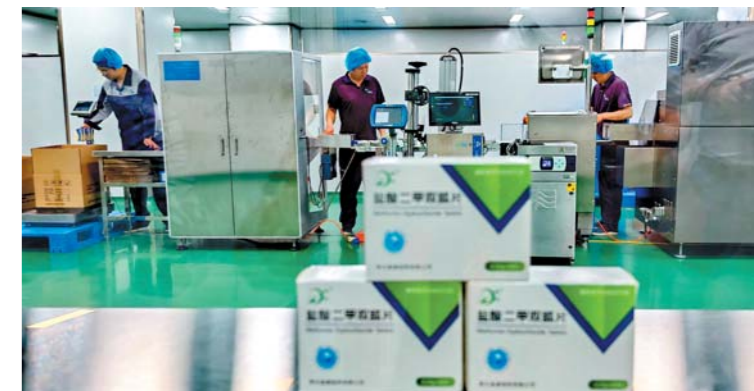
►从一块石头到一粒药片,世界唯一盐酸二甲双胍全产业链“潍坊造”。司马小萌 摄