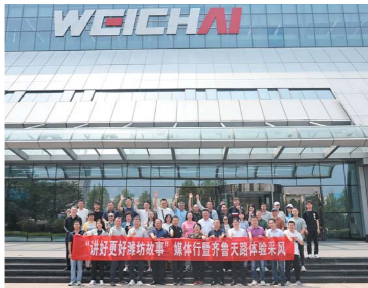
全国30余家媒体总编辑和记者齐聚潍坊。

一地,大家都用自己的手机、相机拍下难忘的瞬间。这些见多识广的总编辑、记者纷纷感慨:确实想不到,潍坊在这些方面已经