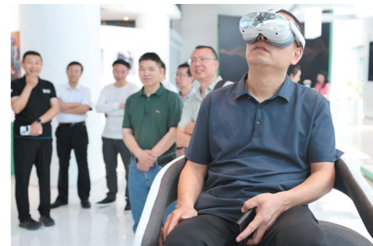
戴上歌尔集团的可穿戴设备,沉浸式体验元宇宙空间。