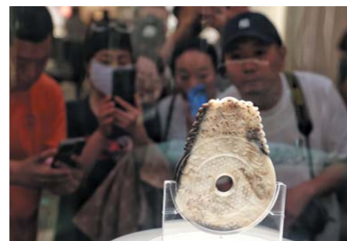
刻有汉字的东汉“子子孙”玉璧国内罕见,是青州博物馆镇馆之宝。