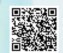
扫码进入齐鲁壹点“好山东”专题