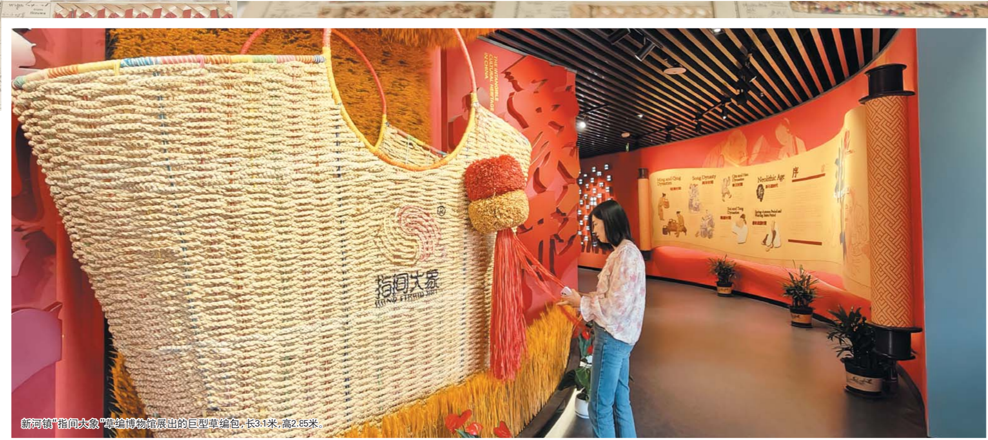
新河镇“指间大象”草编博物馆展出的巨型草编包,长3.1米,高2.85米。

销售利润这把真正的“金钥匙”从海外品牌手中拿回到自己的土地上,新河镇几经探索,“指间大象”品牌应运而生。“大象”二字源于《道德经》:“大音希声,大象无形”。2018年10月,新河镇注册了“指间大象”商标,并成立“指间大象”品牌办公室,进一步整合草编技艺资源,建成全国最大的草编产业加工出口内销基地,与此同时,新河镇围绕非遗文化知识普及、非遗项目体验、新河草编文化展示、研学旅游等核心内容,打造独具特色的“指间大象”草编博物馆,逐步打造国际时尚工艺品产业之都,国内市场份额快速扩展。