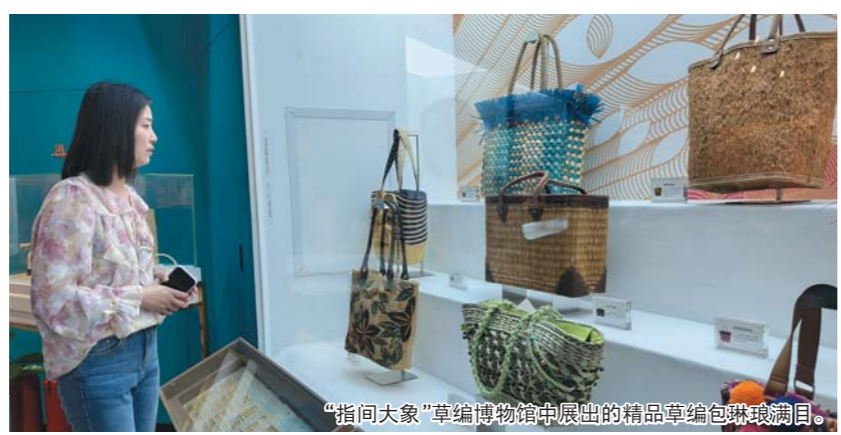
“指间大象”草编博物馆中展出的精品草编包琳琅满目。

作为江北地区最大的草编工艺品加工出口基地,新河草编曾经一直以外贸订单生产为主要模式。庞大的出口短板,掩盖不了“只生产、无销售”的产业困境。为了能够打通国内市场,同时把