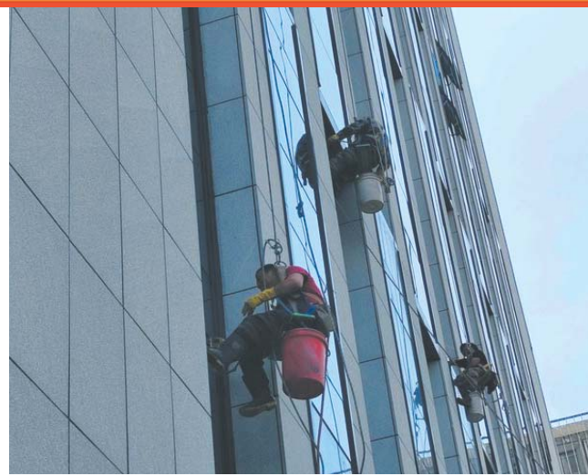
“蜘蛛人”高空作业，除了高温“烤”验，还担心极端天气突袭。

炎炎夏日，奔赴火场的消防员以及高空作业的“蜘蛛人”，直面高温“烤”验不退缩。阳光很炽热，他们很勇敢。