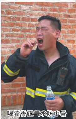
喝着香正气水防中暑

无论气温多高，一旦遇到火警，消防员都要立即奔赴灭火救援第一线！近日，记者跟随济南市章丘区刁镇消防救援站的消防员一起出警，体验“火热战斗”。