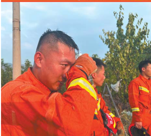
▲每次训练、出警后，消防员都是大汗淋漓。