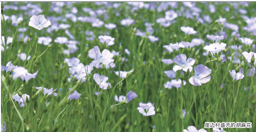
崖边村盛开的胡麻花