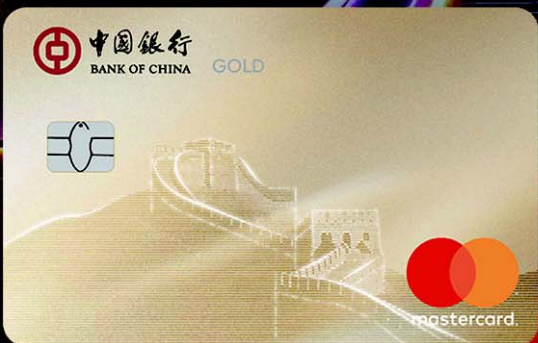
长城万事达金卡数字版