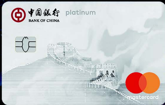
长城万事达白金卡数字版