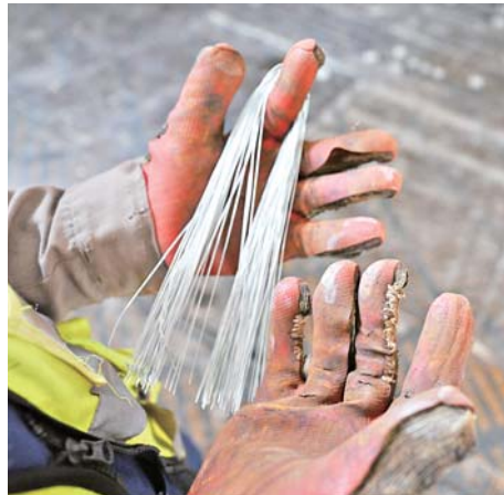
▲高温下的钢筋隔着手套都烫手，干活久了手套被磨损得很厉害。