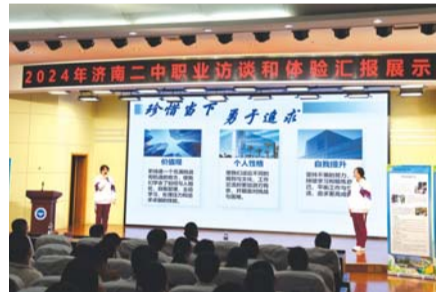
济南二中职业访谈和体验活动汇报展示。