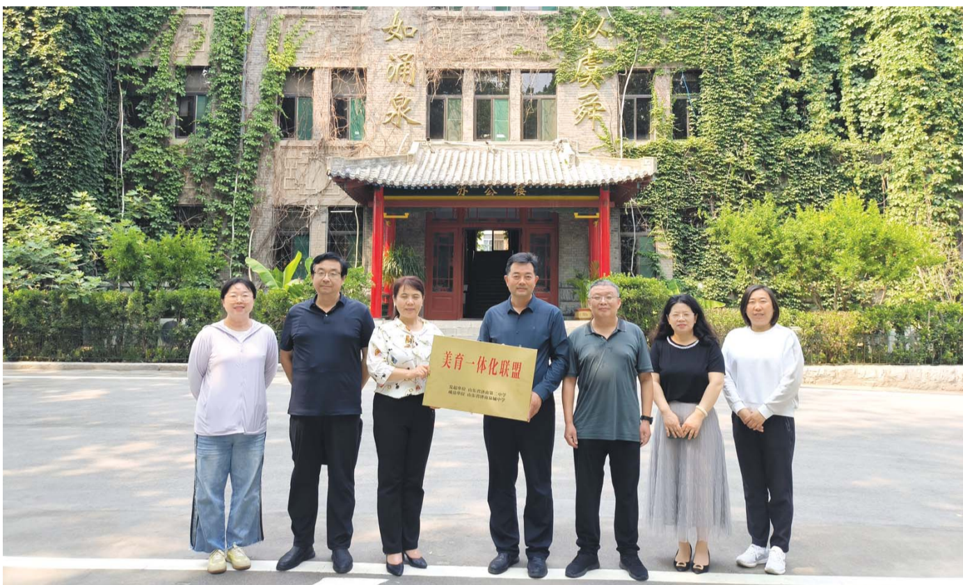
济南二中构建美育一体化联盟。

在时光的长河中，教育如同一座闪耀的灯塔，照亮着学生们前行的道路。山东省济南第二中学，这所拥有百年历史的学府，秉承着“勤朴诚敬 崇德修身”的校训，坚持“以美育人”的办学理念，致力于培养具有正确审美观和审美能力的学生，打造能够传播美、践行美的教师，建设自然美与文化美相融相生的校园。在这里，学生们不仅能够汲取知识的养分，还能感受到美的熏陶，培养出高尚的品德和审美情趣。