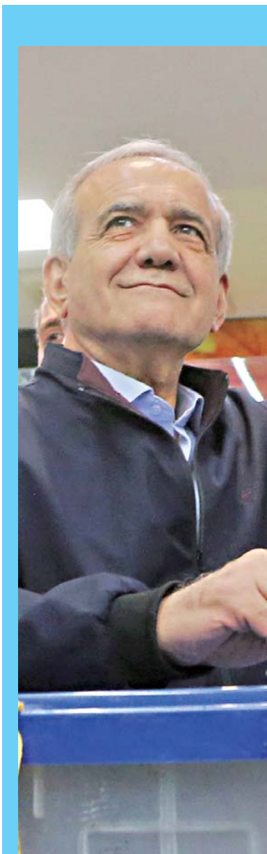
佩泽什基安