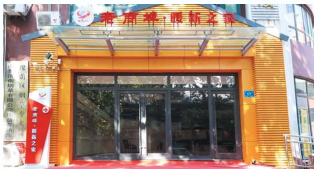
五里沟街道老商埠暖新之家。

们穿梭在街巷之间，分布很广，我们就让他们一边工作一边给社区‘找茬’，由此可以及时地将一些安全隐患等问题及时反馈给我们；因为有‘走街串巷’的优势，社区也会将反诈宣传、普法等宣传资料、节假日安全提醒借助小哥之手送达给社区居民，由此也延伸了网格化治理触角。”