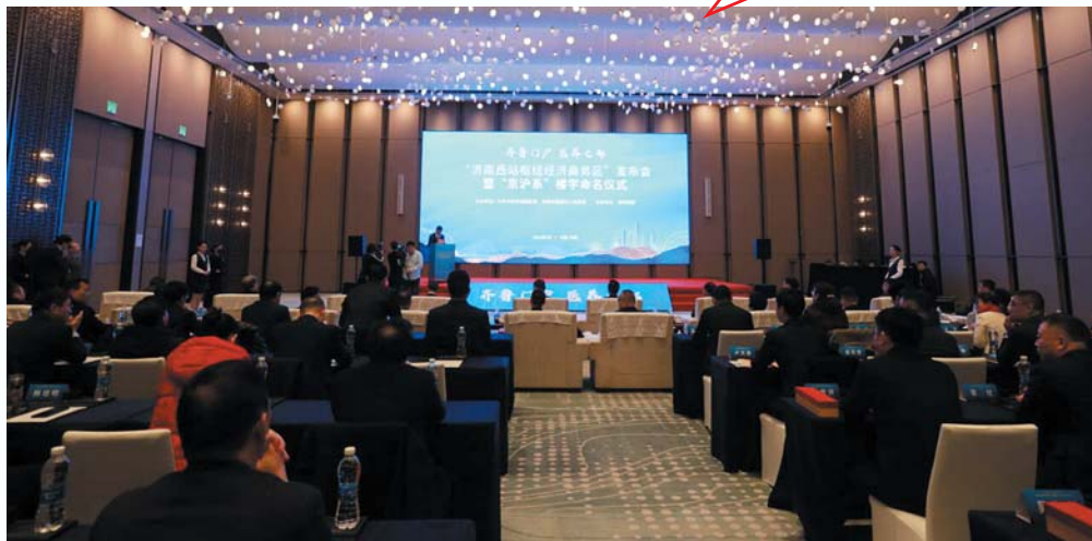
“济南西站枢纽经济商务区”发布会暨“京沪系”楼宇命名仪式在皇冠假日酒店拉开帷幕。

“增强发展韧性，增进民生福祉，全力争当‘强新优富美高’新时代社会主义现代化强省会建设排头兵”，2024年，槐荫区目标明确且坚定，而高质量的党建引领，便是实现这一蓝图的“金钥匙”。8条产业链链上企业为主的产业链党委相继成立，每万城镇人口社区工作者配备达20人……一个发展有速度、城市有温度、生活有态度的槐荫正向我们走来。