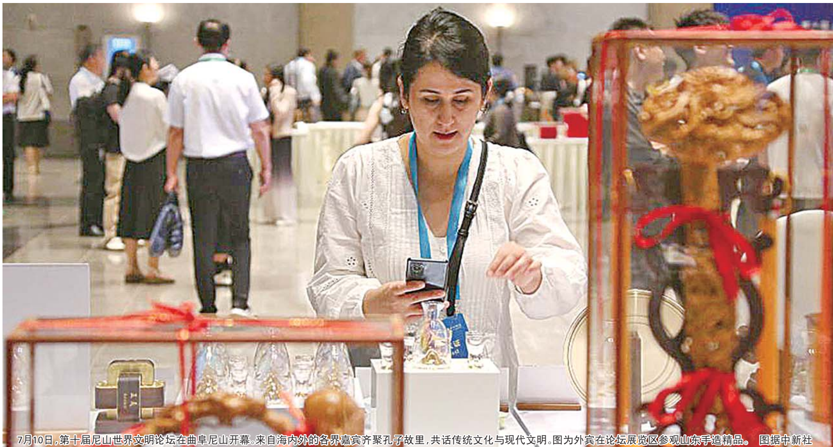
7月10日,第十届尼山世界文明论坛在曲阜尼山开幕。来自海内外的各界嘉宾齐聚孔子故里,共话传统文化与现代文明。图为外宾在论坛展区参观山东手造精品。