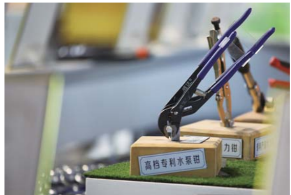
高档专利水泵钳产品展示。

文登扳钳制造业的发展并非一蹴而就，而是经过了多年的积累和沉淀。从最初的小作坊式生产到如今的规模化、现代化、智能化制造，文登扳钳踏上了一条不平凡的发展之路。