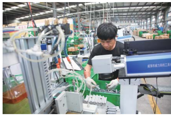
车间里自动化生产线让人震撼。