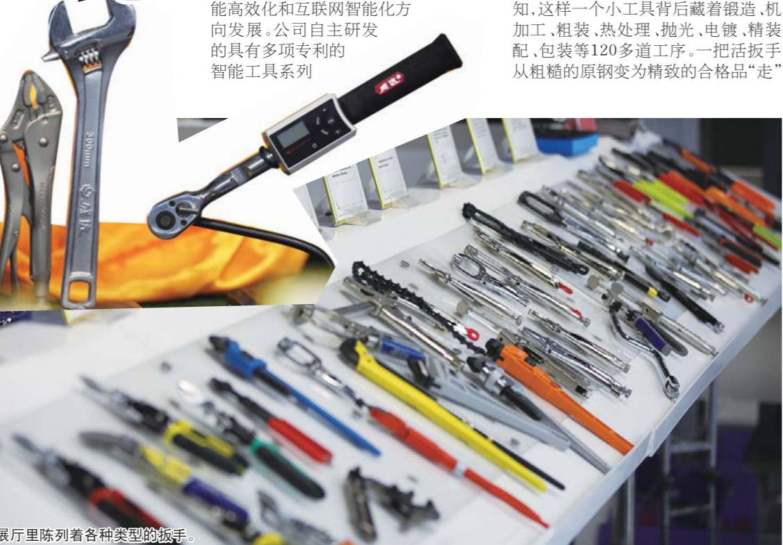
展厅里陈列着各种类型的扳手。