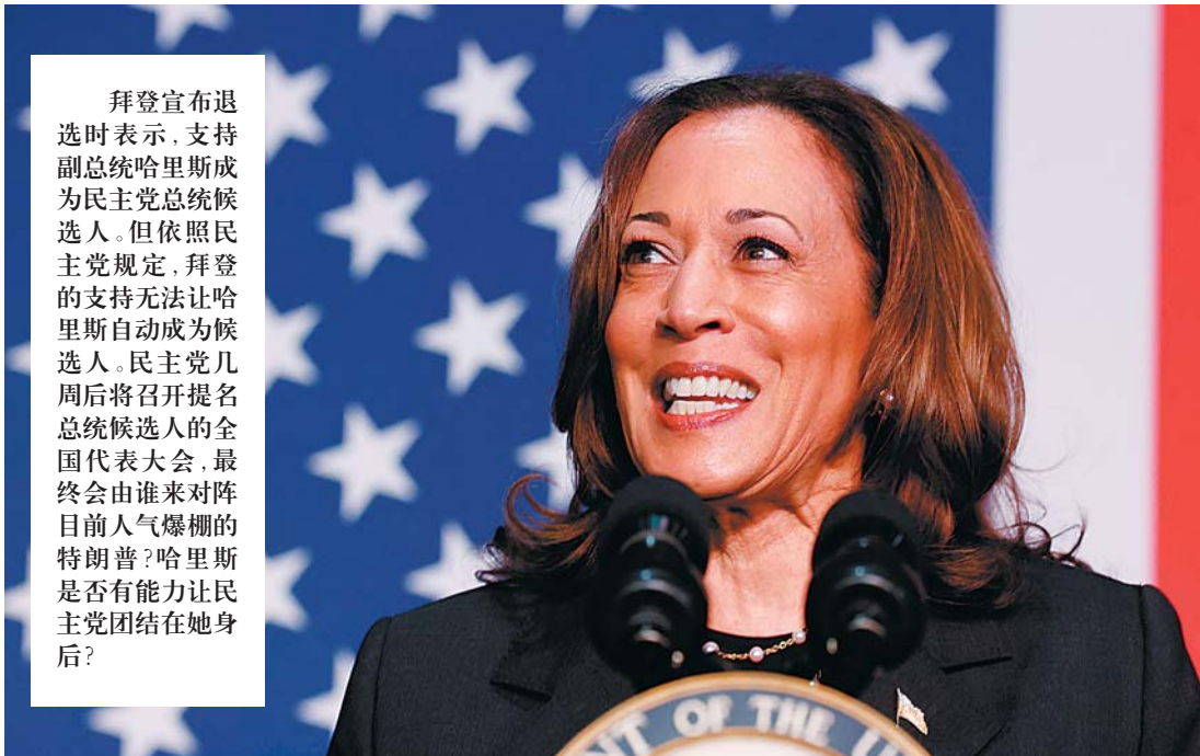
7月17日，美国副总统哈里斯在密歇根州波蒂奇发表讲话。

拜登宣布退选时表示，支持副总统哈里斯成为民主党总统候选人。但依照民主党规定，拜登的支持无法让哈里斯自动成为候选人。民主党几周后将召开提名总统候选人的全国代表大会，最终会由谁来对阵目前人气爆棚的特朗普？哈里斯是否有能力让民主党团结在她身后？