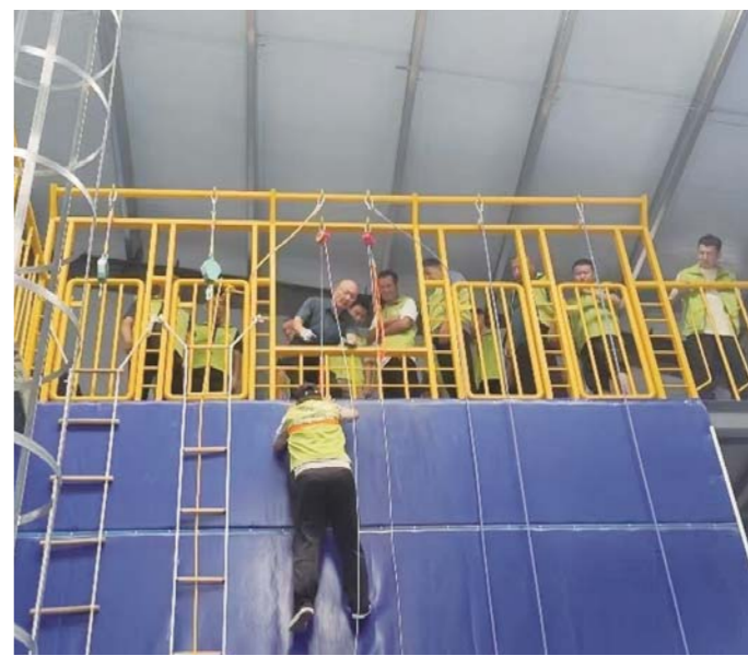
参训人员在济南市安培职业培训学校工伤预防实训基地接受培训。

为进一步提高济南市建筑施工行业从业人员业务水平,提升施工安全管控能力,减少工伤事故发生,8月2日至3日,由济南市人社局、济南市住建局主办,齐鲁晚报·齐鲁壹点、舜网、济南市安培职业培训学校联合承办的“防工伤、保安全”2024年济南市建筑施工企业工伤预防安全培训活动在济南市安培职业培训学校实训基地开班,80名来自济南四建的职工代表参与培训。