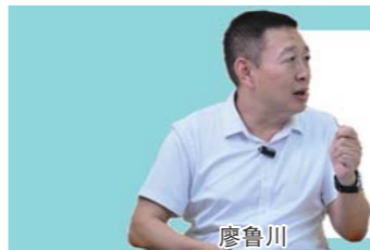
文/片 陈晨 王颖颖 路董萌 刘志坤 戴伟 滨州报道