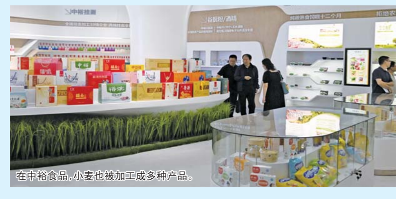
在中裕食品,小麦也被加工成多种产品。