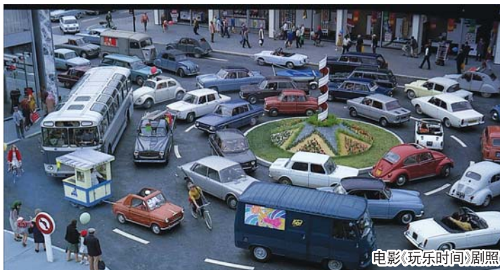
电影《玩乐时间》剧照

风情与魅力的城市，无论是黑白录像还是现代电影，都能看到爱情故事与法国电影之间千丝万缕的联系，无论是以爱情为主线的电影，还是借助爱情故事探讨更为深刻话题的电影，都曾在巴黎