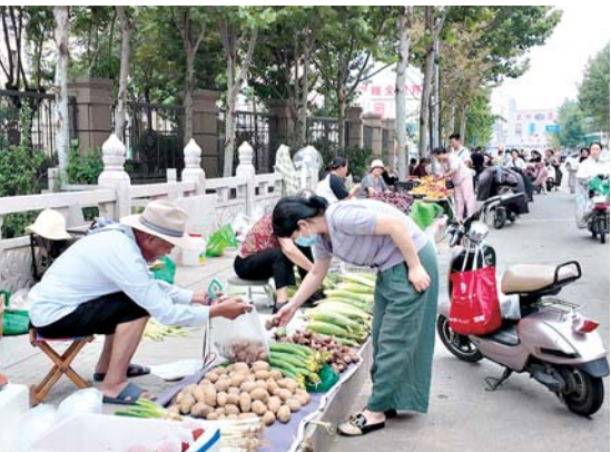
菜价上涨,市民买菜也开始“憋”着点了。