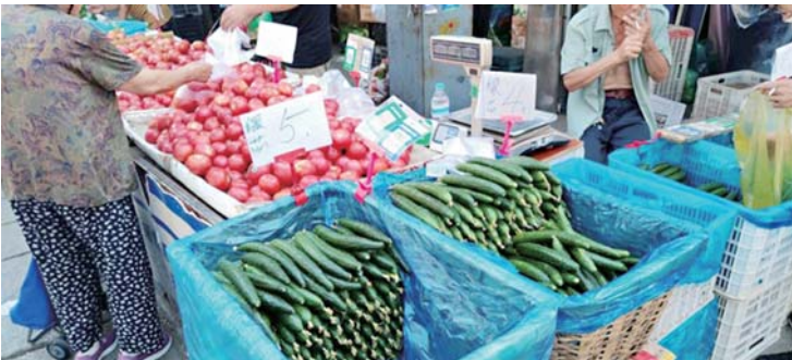
市场青黄不接，“高价菜”还得再吃一段时间。

济南市商务局最新发布的统计信息显示，进入伏天后，全市气候炎热，不利于蔬菜采收上市，同时运输、保鲜成本提高；另一方面，南方地区出现多次强降雨，导致部分蔬菜减产，物流和交通运