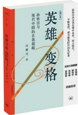
《英雄变格：孙悟空与现代中国的自我超越》白惠元 著 生活·读书·新知三联书店

（本书摘自《英雄变格：孙悟空与现代中国的自我超越》，内容有删节，标题为编者所加）