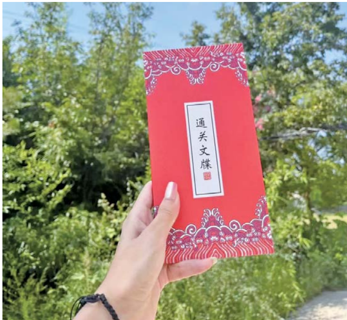
灵岩寺景区给“天命人”定制的“通关文牒”纪念品。