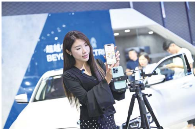
各大汽车品牌除了在场的销售人员,还有不少主播开启线上直播。

上线仪式现场,由齐鲁晚报·齐鲁壹点开发的虚拟数字人闪亮登场,对“车行齐鲁”大平台进行全面细致的介绍。自布局元宇宙赛道以来,齐鲁壹点数字传媒产业尝试“多点开花”,壹点天元元宇宙空间首创式推出多个元宇宙应用案例。其中,虚拟数字人作为元宇宙的基本入口之一,齐鲁壹点对此也进行了大量开发与应用探索。本次上线仪式亮相的虚拟