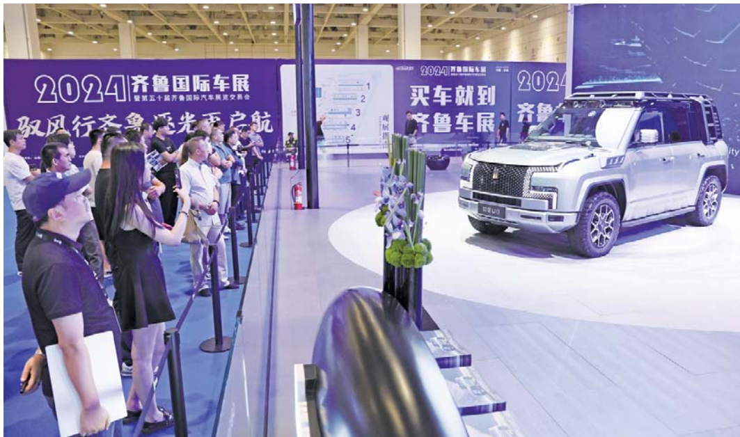
3号展厅内,百万级国产高端新能源越野车仰望U8,凭借科技感十足的外形、豪华的内饰,以及强大的性能备受瞩目。

9月5日,以“驭风行齐鲁,逐光再启航”为主题的2024齐鲁国际车展(秋季)暨第50届齐鲁国际汽车展览交易会在山东国际会展中心盛大开幕。与会领导、参展品牌代表共同出席开幕仪式,与来自国内外的各大汽车品牌展商和消费者共襄第50届齐鲁国际车展这一车市盛会。