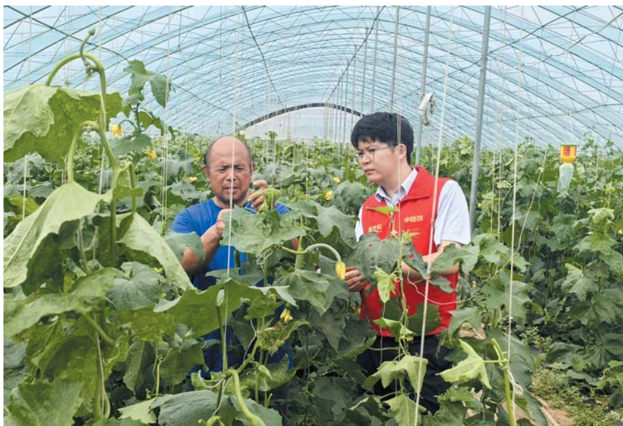
银行客户经理走访种植户。

提升服务效能,做实业务督导。切实贯彻“走出去,请进来”工作思路。通过驻点办公、红马甲行动等方式提升全方位金融服务水平。以“两两结对”方式,形成“一名客户经理+一名内勤员工”的固定搭配,持续对曲堤蔬菜市场商户、辖内黄瓜种植户进行全覆盖走访,讲解金融政策,对有资金需求的种植户,及时跟进,确保服务到位。累计走访大棚种植户2400户。及时复盘开展工作座谈总结,分