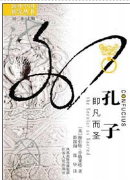
《孔子:即凡而圣》 [美]赫伯特·芬格莱特 著 彭国翔 译 江苏人民出版社