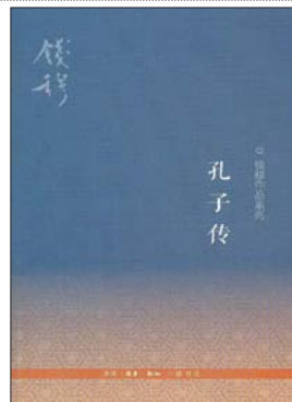
《孔子传》 钱穆 著 生活·读书·新知三联书店