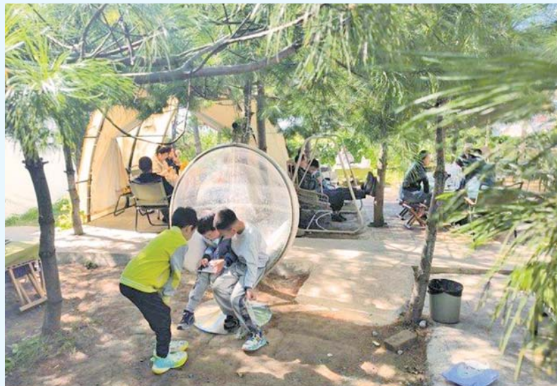
国庆假期，济南郊区的农家乐也异常火爆。亲朋好友品尝农家菜，体验田园生活的乐趣，不失为一种休闲度假的好选择。

阳表示，当前文旅市场人潮涌动，消费活力持续释放，文旅业在促进经济转型升级、引导扩大消费、满足人民美好生活需要等方面发挥着越来越重要的作用。