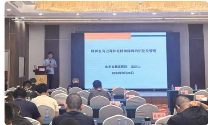
定期为基层卫生单位开展培训讲座。

医院创新性地在全市建立起了市-县-街道(乡镇)-社区(村)四级管理工作体系,在全面提升精神卫生服务能力的同时,更筑牢了全市严重精神障碍管理治疗新屏障。通过定期随访、培训等形式,医院将管理工作和医疗救治工作紧密结合起来,让出现病情反复等情况的患者得到及时、有效地救治,并通过分级诊疗模式,将医院优质医疗资源更好地利用起来。“在精神障碍患者的治疗方面,医院主要采取药物治疗、物理治疗等多种技术相结合的方式对患者进行诊断和治疗;在患者的救治救助方面,医院积极推行特病救助、残联救助等项目,为符合条件的门诊患者发放免费药品,让严重精神障碍患者享受更有温度的治疗。”王中刚介绍,2023年,济宁市严重精神障碍患者管理综合评分居全省首位。