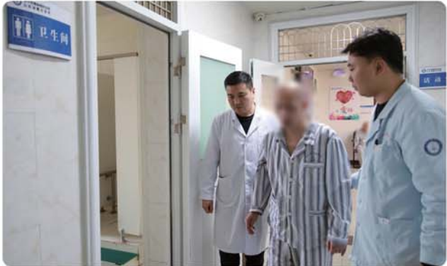
医护搀扶行动不便的“三无”患者如厕。

所领导带班、民警巡控、医护巡诊、辅警值守、监控督查的‘五位一体’勤务模式,实行‘一人一档’精细管理,全流程记录病情、案情、发病史、家庭信息、执行文书等信息,确保了医疗、看护、监管安全无缝隙。”韩道国介绍。医护人员坚持以人为本,建立“周一警医联席会、周二安全卫生检查、周三诵读《弟子规》、周四法制讲堂、周五健康体检、周六齐唱红歌、周日心理疏导”的管理机制及“每周心理疏导、每月联席会商、每季度专家会诊、每半年诊断评估”的治疗机制,积极协调为6人办理社保证、缴纳医保费,定期为困难患者开展捐款、捐物活动,解决相关人员的家庭负担。