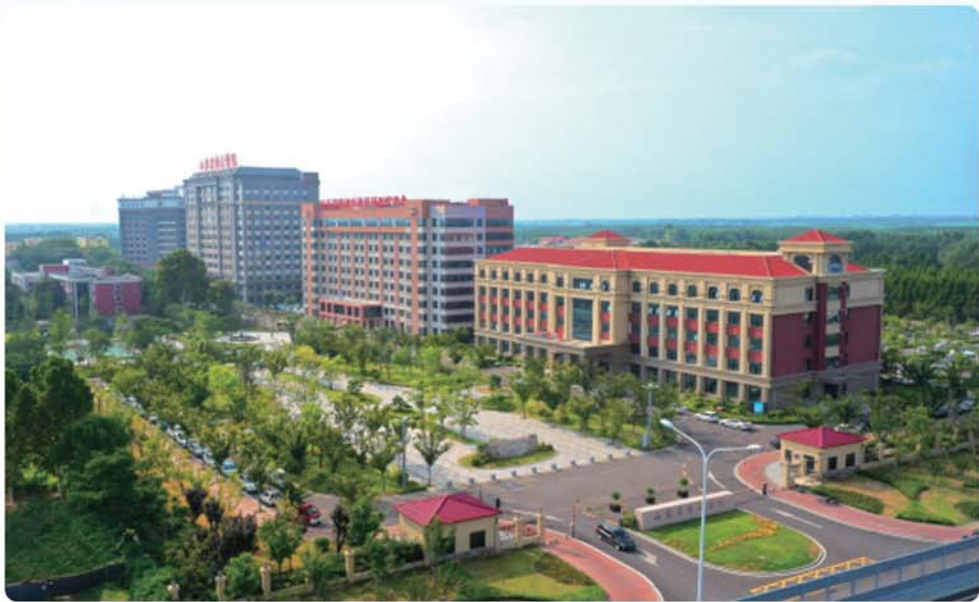
山东省戴庄医院院景。

2024年10月10日是第33个世界精神卫生日,今年主题为“共建共治共享·同心健心安心”。作为集神经精神疾病医疗、教学、科研、司法鉴定、职业病防治于一体的三级甲等精神专科医院,山东省戴庄医院近年来落实国家、省、市关于社会心理服务建设工作的相关要求,充分发挥公立医院专业支撑作用,积极健全公共卫生体系建设,提升心理健康和精神卫生工作水平,不断强化措施落地,相关工作取得积极成效。