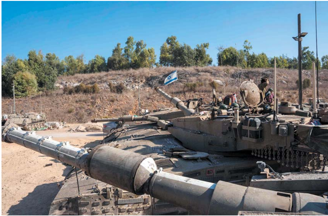
以色列国防军10月1日开始在黎巴嫩南部边境地区进行“有限地面行动”。图为以军坦克部队。

联合国驻黎巴嫩临时部队(联黎部队)当地时间13日发表声明说，当天凌晨4时30分左右，以色列国防军两辆坦克破坏位于拉米亚的联黎部队驻地大门，强行进入驻地。以军方称，坦克当时在被迫后退躲避危险，并非袭击驻地。