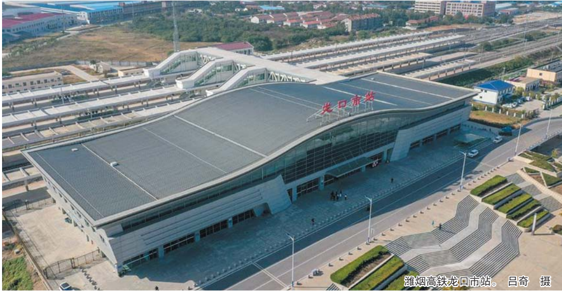
潍烟高铁龙口市站。

潍烟高铁全线设9站,其中烟台境内设7站,包括莱州站、招远站、龙口市站、蓬莱站、烟台西站、福山南站、芝罘站。线路开通后,将改写胶东半岛北部地区无高铁的历史,