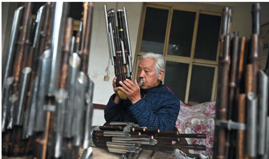
最后调整好音色，一把笙才算彻底制作好了。