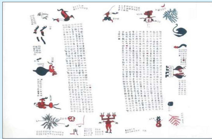
楚帛书第一卷《四时令》