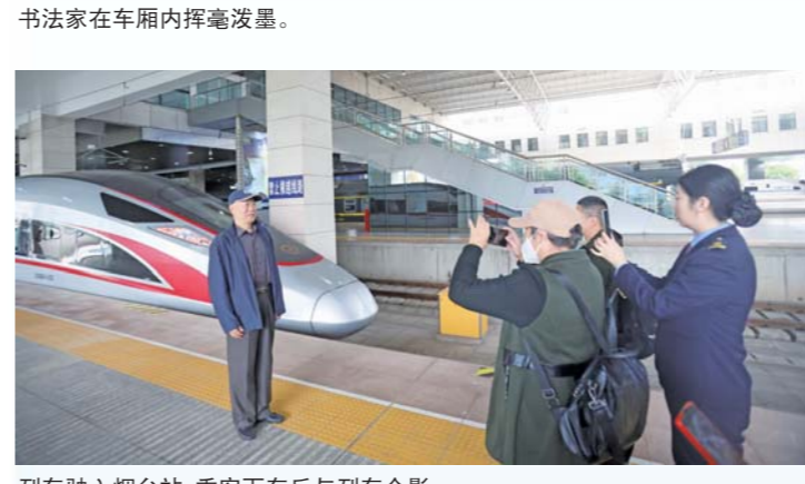
书法家们在车厢内挥毫泼墨。