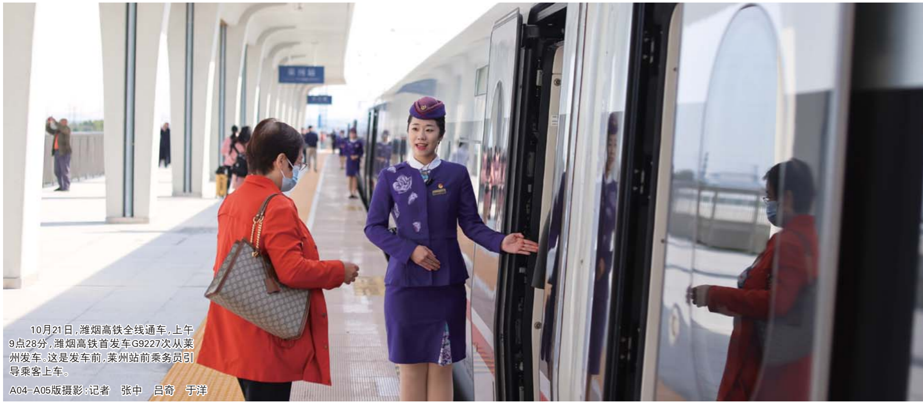
10月21日,潍烟高铁全线通车。上午9点28分,潍烟高铁首发车G9227次从莱州发车。这是发车前,莱州站前乘务员引导乘客上车。 A04-A05版摄影:记者 张中 吕奇 于洋

具有极大的市场开发潜能和客流前景。 大文豪苏东坡900多年前就将诗与远方具象化,他曾在蓬莱留下海诗——“东方云海空复空,群仙出没空明中”。驿动的心,在诗与远方的遐想中蠢蠢欲动。坐上高铁游烟台,经一站,赏一城,美一路。看花、赏金,登山,寻仙,品美食,饮美酒,沿线各地文旅部门也已经使出浑身解数,迫不及待地把烟台美给你看,期待各地游客来打卡。 山海情怀生生不息,城市发展一“路”向前,烟台纵横驰骋的信心更足了,天地更广阔了。 烟变,崛起,环渤海地区中心城市的远景目标也更加清晰了。