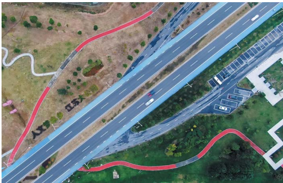
▲“千垛美路”被交通运输部评为全国十大最具乡愁的路。