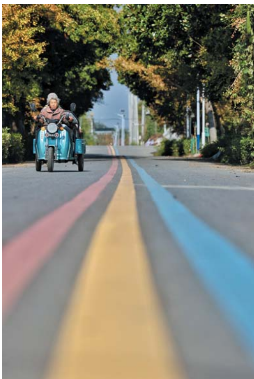
在泰兴宣堡镇，硬化公路修到家门口，村民圆梦幸福路。