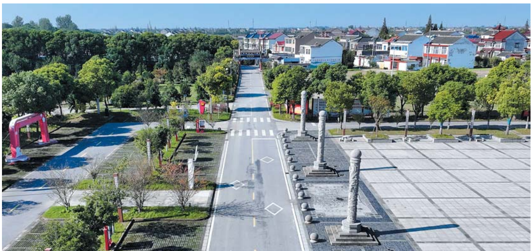
便利的交通使得祁巷村的民宿、农家乐、现代农业产业园快速发展，乡村旅游大大提高了村民收入。