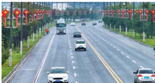
泰州市姜堰区的环太湖路连接了多个景点，推动旅游业的发展。