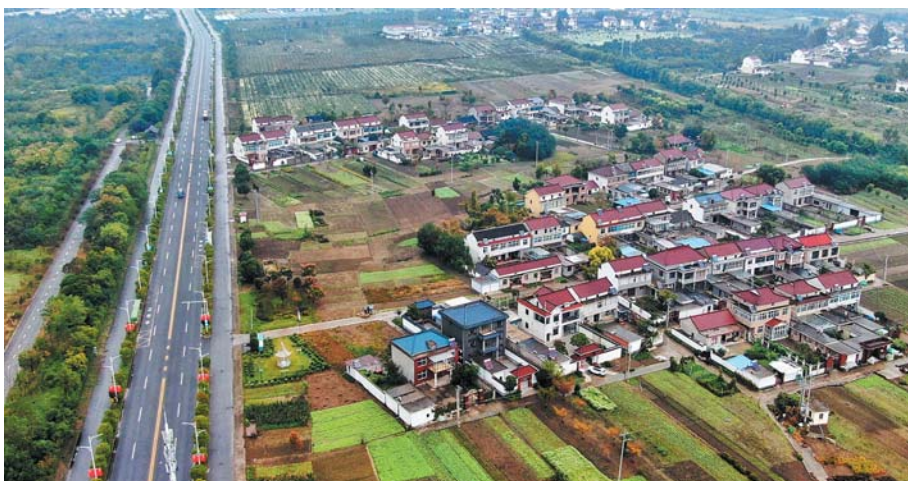
“一路高畅”品牌公路是一条集康养休闲、旅游观光为一体的特色农村公路。