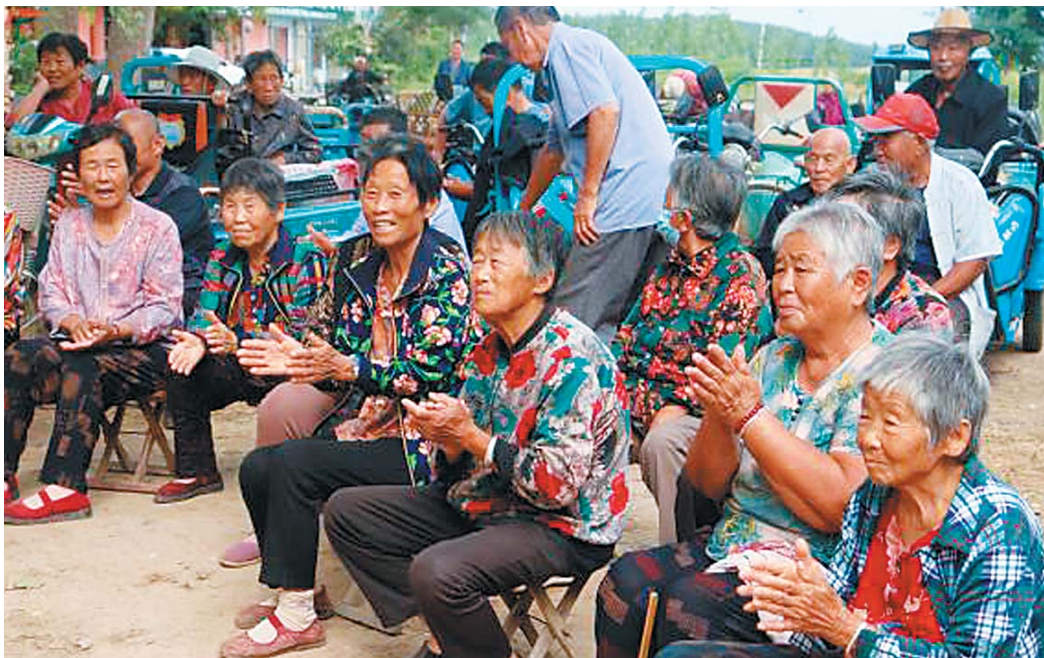
听戏的都是附近村里的老年人。

行业已经有40年了，从年轻当兵时就在文工团受到熏陶，退伍后自己成立了剧团，至今已经演出快十年了。目前，剧团有13位演员，各个能歌善舞，吹拉弹唱更不在话下。他们坚持在垛石演出，近三年表演的场次高达1000余场。剧团的新编曲目《文明嫁娶》《婆媳模范》《贤惠媳妇孝顺儿》《绣绣新济阳》《借灯光》等具有浓郁的乡土气息和较强的时代感，受到戏迷们的一众追捧。