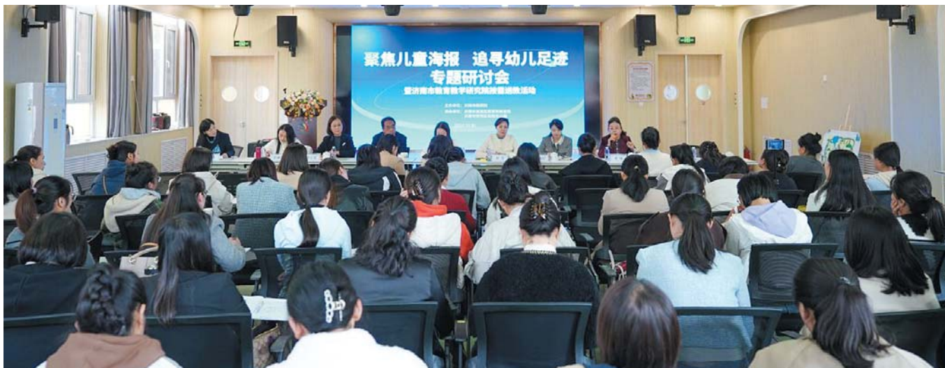
莱芜区实验幼儿园举办专题研讨会。