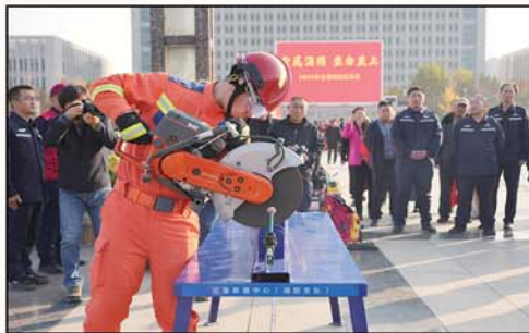
应急队员展示切割锯锯铁丝技能。