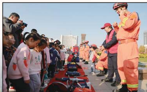
种类多样的消防救援工具器材吸引广大居民驻足观看。