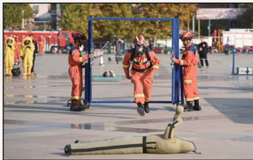
应急战斗员进行单兵破拆障碍转移伤员技能操作。