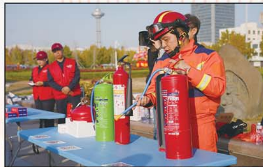
应急队员向公众讲解多种类灭火器材及使用事项。