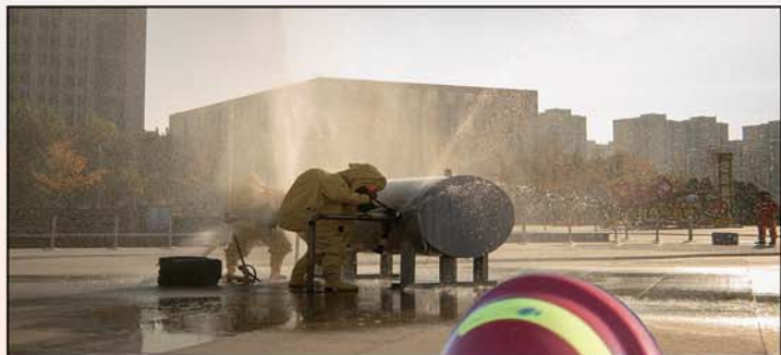
应急战斗员着重型防化服进行油罐带压堵漏技能操作展示。