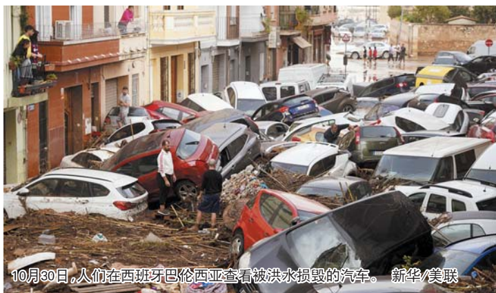
10月30日，人们在西班牙巴伦西亚查看被洪水损毁的汽车。