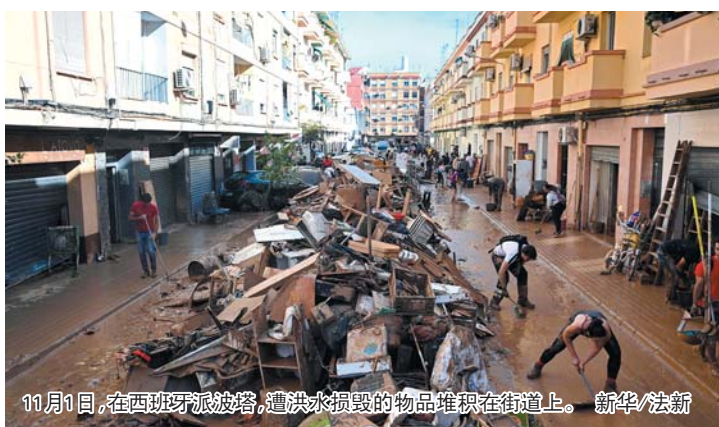
11月1日，在西班牙派波塔，遭洪水损毁的物品堆积在街道上。