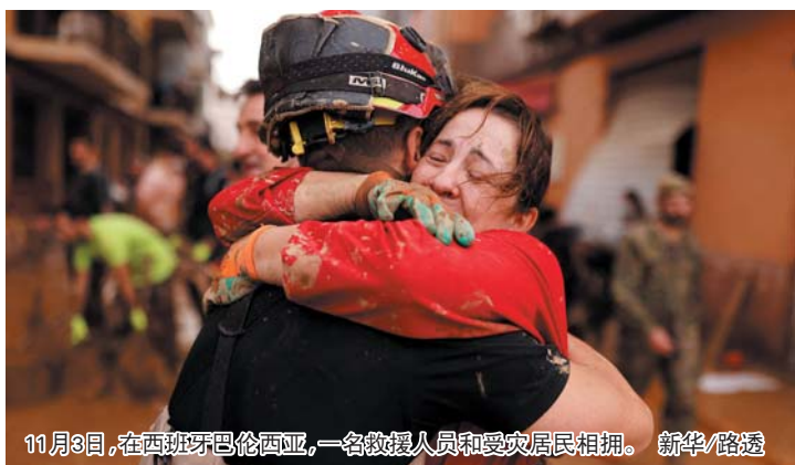
11月3日，在西班牙巴伦西亚，一名救援人员和受灾居民相拥。

第二天早上，后来我和一个邻居拿着绳子去救他，却发现他已经不见了。从那以后，我再也没有收到任何关于他的消息。”