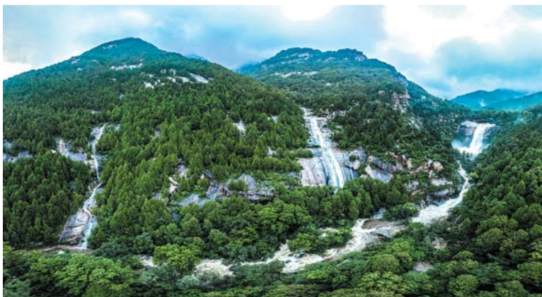
▲ 泰山云龙三现 宿磊