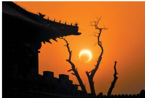
◀ 日环食一岱庙 翟健