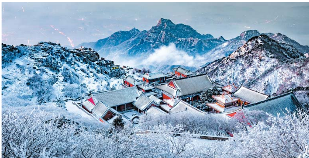
▼ 碧霞冬雪 陈爱国