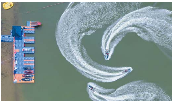
► 蛟龙戏水 陈忠明