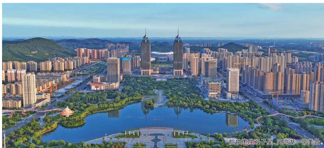
航拍枣庄双子星、凤鸣湖一带美景。