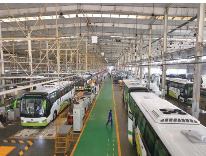
中通客车在产品质量上精益求精，赢得了海内外市场的广泛认可。

障和改善民生始终扛在肩上，从人民群众关心的事情做起，从人民群众满意的事情做起，全力提升宜居生活品质，着力提升城市功能品质。