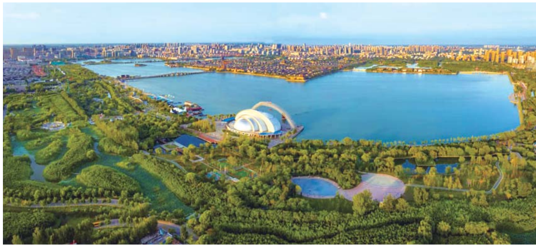
“江北水城 运河古都”之称的聊城，水城相依，和谐共生。近年来，聊城借助得天独厚的区位优势，着力打造“两河文化”品牌。

和灿烂的文明，成为齐鲁大地上一颗璀璨的“两河明珠”。 时空华彩笔，旧貌换新颜。运河岸边的垂柳年轮画了一圈又一圈，岁月的洗礼带来了无数的改变，这座城市，讲述着一个接一个向前发展的磅礴故事。