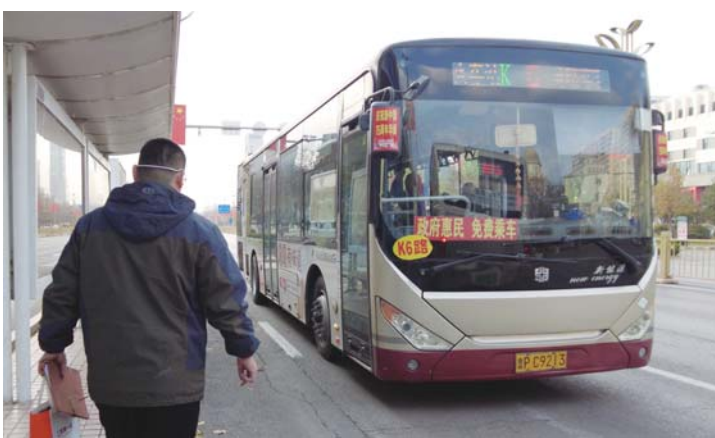
聊城在全省率先出台“供暖季免费乘坐公交车”的惠民举措，今年是第五个年头。