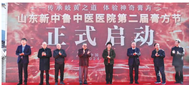
第二届膏方节启动仪式现场。