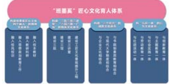
(一)构建“班墨奚”匠心文化

枣庄职业学院坚持立德树人，把打造“班墨奚匠心文化”作为人才培养的一个突破点，充分发挥枣庄作为中国工匠文化重要发祥地、工匠精神诞生地的文化品牌优势，深入挖掘鲁班、墨子、奚仲等枣庄古代工匠大师的历史文化资源和时代内涵，大力实施“工匠精神培育工程”，系统构建工匠精神培育体系，努力打造“班墨奚”匠心文化职教品牌。通过构建班墨奚匠心文化“四个融入”的精神文化体系；构建“四层递进”的物质文化体系；构建“三个结合”的制度文化体系；构建“五位一体”的行为文化体系等四个方面，创新文化育人思路，取得了优异的成绩。