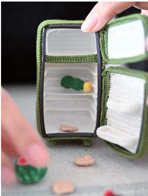
“娃娃屋”的冰箱可以打开，风扇可以转动，电灯可以亮。