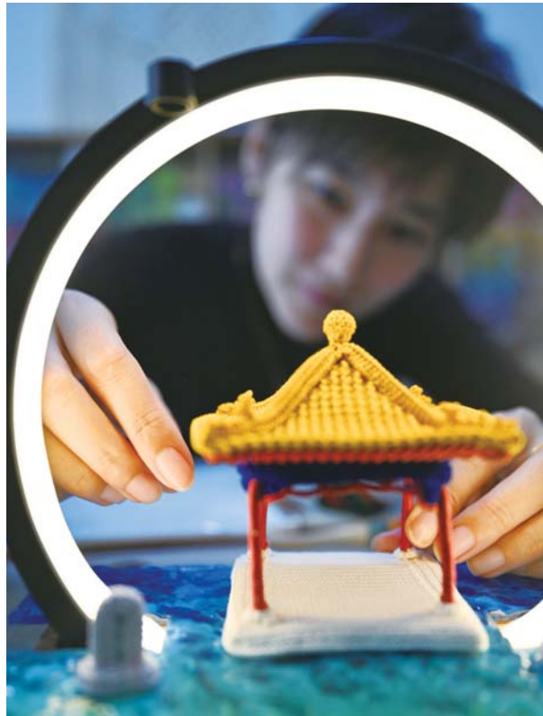
她用五个小时钩织出趵突泉。