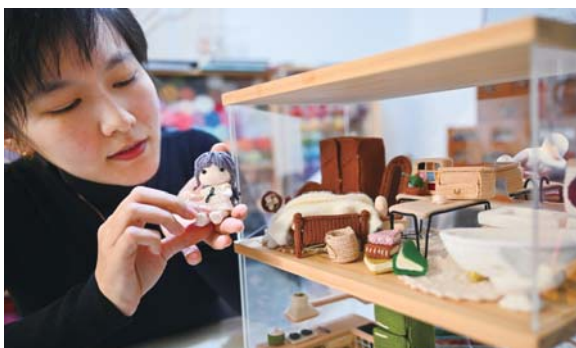
法文静制作的娃娃屋惟妙惟肖。