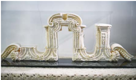
法文静复刻的圆明园。