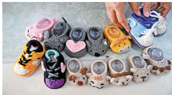
法文静给女儿织的小鞋子，伴随了女儿的成长。