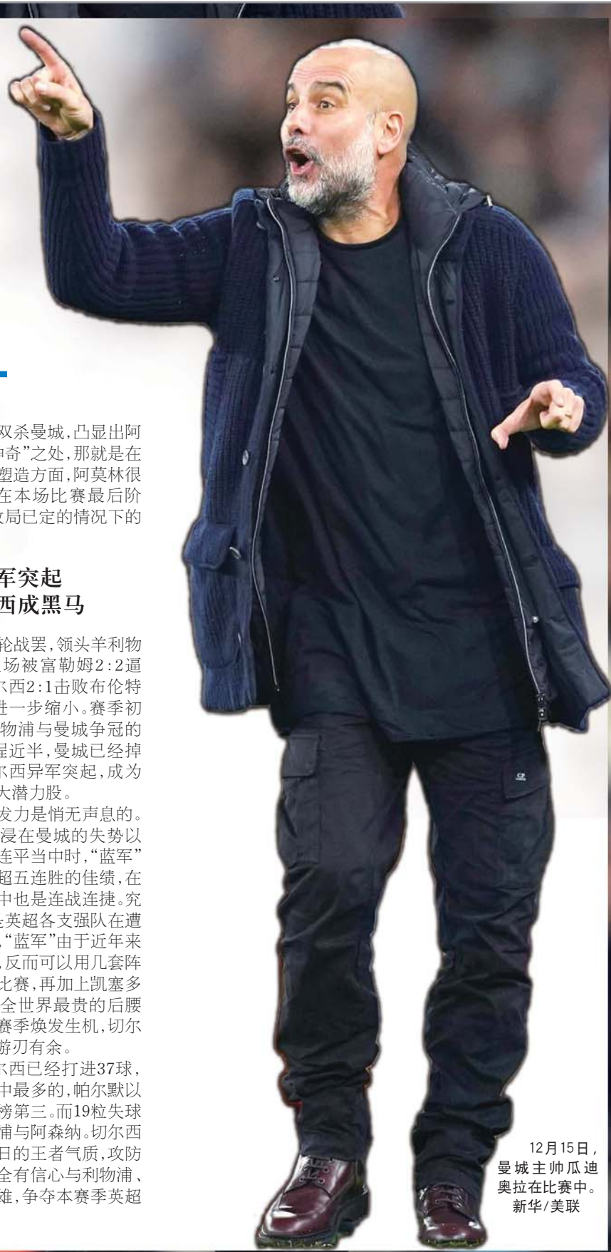
12月15日，曼城主帅瓜迪奥拉在比赛中的照片。

目前，切尔西已经打进37球，是英超球队当中最多的，帕尔默以11球排名射手榜第三。而19粒失球也仅次于利物浦与阿森纳。切尔西渐渐找回了昔日的王者气质，攻防俱佳的他们完全有信心与利物浦、阿森纳一决雌雄，争夺本赛季英超冠军。