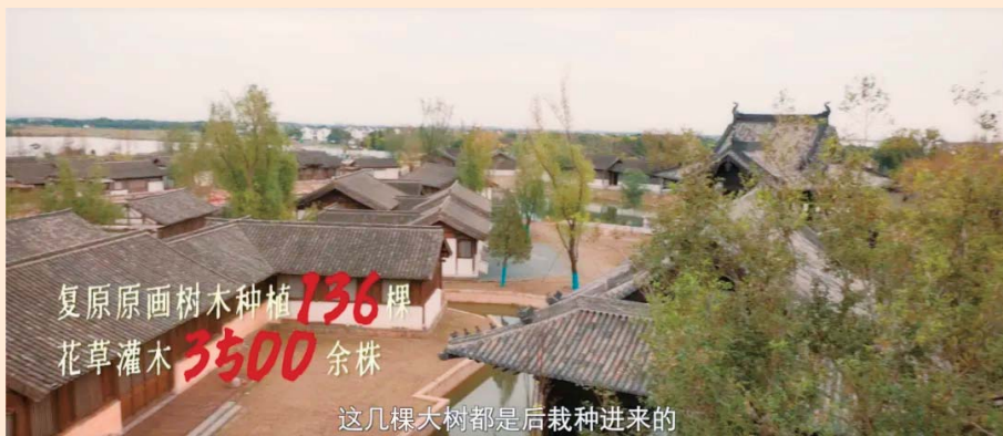
古装剧《清明上河图密码》复原原画,树木种植136棵,花草灌木3500余株。