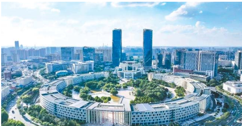
位于济南高新区的齐鲁软件园拥有高端软件产业集群。