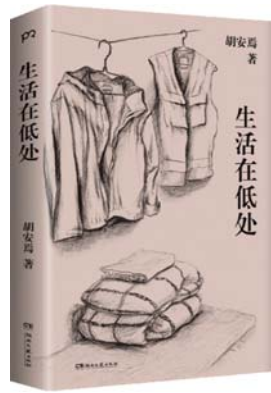
《生活在低处》 胡安焉 著 浦睿文化 | 湖南文艺出版社