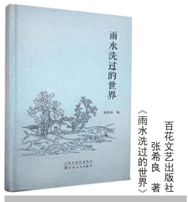
百花文艺出版社 张希良 著 《雨水洗过的世界》

散文要追求真，所表达的应是作者所见、所闻、所感，都是触动心灵的，也只有真情实感才能打动人、感染人。《久旱逢甘霖》《梧桐花情结》《记忆里的高庄大集》《和柳树为邻》等作品，语言细腻，视