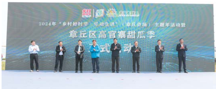
高官寨甜瓜季启动仪式。