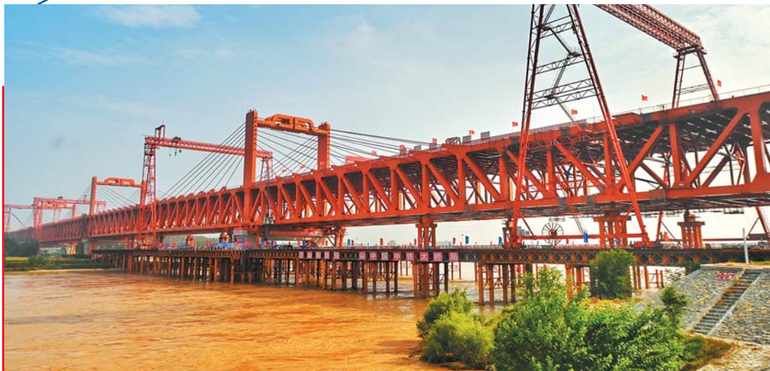
济滨高铁济阳黄河公铁两用特大桥合龙贯通。

今年以来，高官寨街道全面落实全区“六大行动”，紧抓黄河重大国家战略不放松，坚持稳中求进，以进促稳、先立后破，以党建为统领，以高质量发展为目标，勇毅笃行，用拼搏奋进、矢志不渝书写发展篇章。