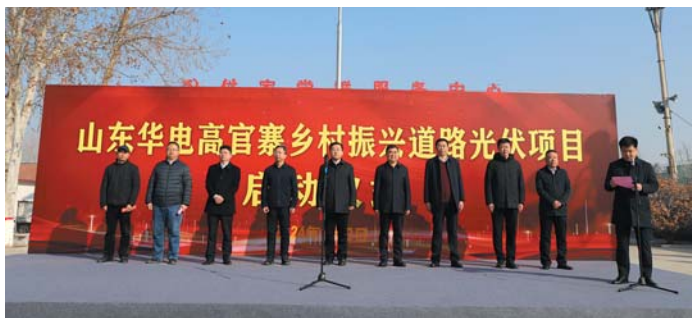
付家村华电乡村振兴道路光伏试点项目启动仪式。