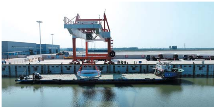
章丘港大件航线运输。