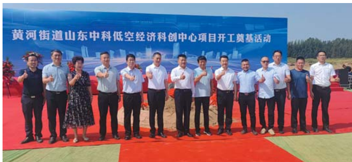
项目突破:山东中科低空经济科创中心项目开工。