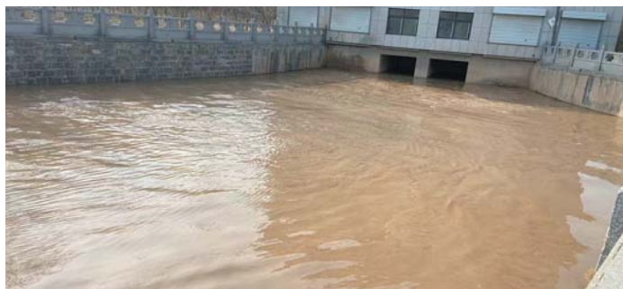
民生实事:保障农业农田灌溉。