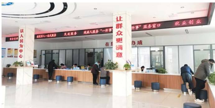
社会保障:行政审批一窗受理、一次办好。