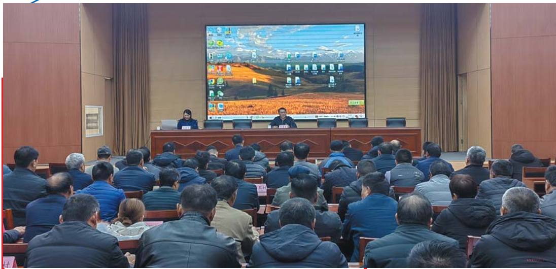
党建引领:开展党员教育培训。

街道坚持“项目为王”理念,紧抓“双招双引”,以“一体谋划现代高效农业为基础,农业、工业、商业为主导”的三产融合发展体系,山东供发集团、华兰食品、绿动环保、凤润食品、胜隆化工、鲁虹电机等企业蓬勃发展。市重点项目章丘区生活垃圾焚烧发电项目二期工程进展顺利;区重点项目华兰智能化生态食品工厂(一期)项目即将投产达效;中科低空经济产业园进展顺利,该项目目