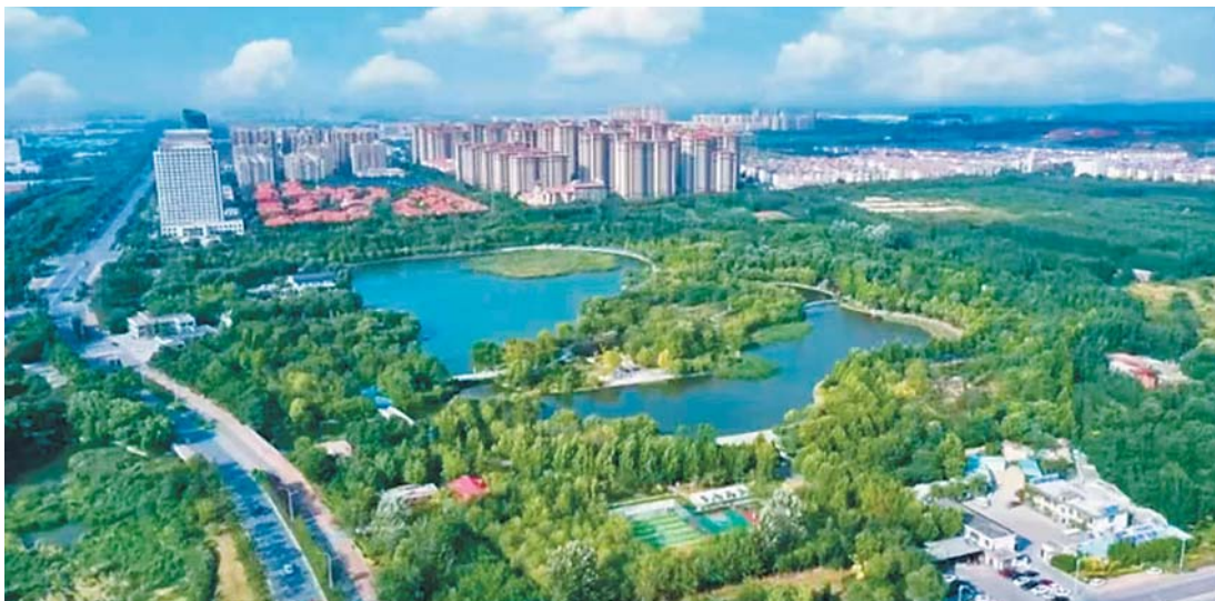
济南高新区今年进入“三次创业”发力之年。

推进“三次创业”，打造“公园里的科技城市”，再造一个新高新，迈入“十四五”规划收官之年，济南高新区蹄疾步稳，各项工作向前赶超。2024年，济南高新区全面开启“三次创业”，统筹推进稳增长、强产业、抓改革、防风险、惠民生，取得优异成绩。2025年，济南高新区将以“再造一个新高新”为总目标，扎实推进经济社会高质量发展，奋力谱写“三次创业”新篇章。