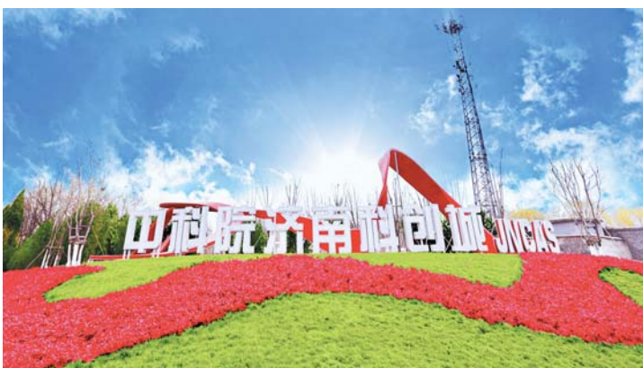
不断推动科技研发与成果转化。

创新能级的提升，项目的优化，为济南高新区的经济发展注入无限活力。2024年前三季度，济南高新区实现地区生产总值1425.9亿元，同比增长6.5%，在全国前20强开发区中居前五位；1—11月，规上工业总产值、规上工业增加值、进出口总额等指标保持快速增长，有力发挥了全市经济社会发展“主引擎、主阵地、主力军”作用。